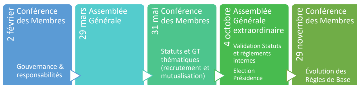
Temps forts du Groupement en 2022

La révision des Règles de Base, l'application des critères qualité ainsi que des procédures internes est prévue pour 2023.