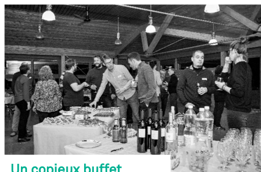
Un copieux buffet