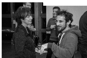
Des rencontres et des retrouvailles