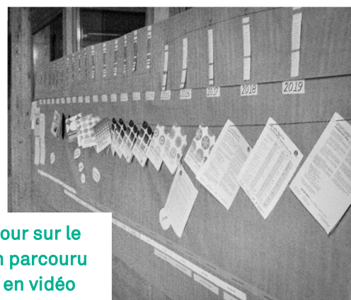
Un retour sur le chemin parcouru aussi en vidéo